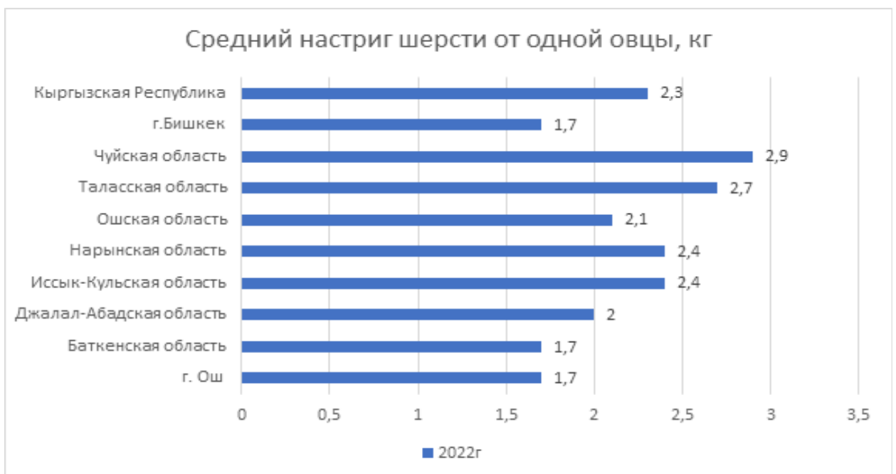
Диаграмма 3. Средний настриг шерсти от одной овцы, кг

Переходное волокно характеризуется тониной шерсти от 30 до 52 мкм, состоит из чешуйчатого, коркового и сердцевинного слоев. Сердцевина развита слабо, прерывистая, но может и отсутствовать, тогда переходное волокно от пуха можно отличить лишь по строению чешуйчатого слоя, в котором расположение чешуек не кольцевидное (у пуха), а кольцевидно-сетевидное. Переходное волокно в смеси с остью и пухом входят в состав шерсти грубошерстных и полугрубошерстных овец. Шерстяной волокон покров