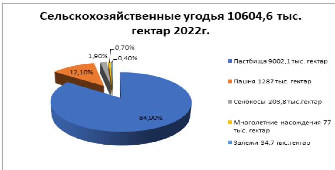
Диаграмма 1. Площадь земельного фонда по видам сельскохозяйственных угодий по Кыргызской Республике (тыс. гектаров)