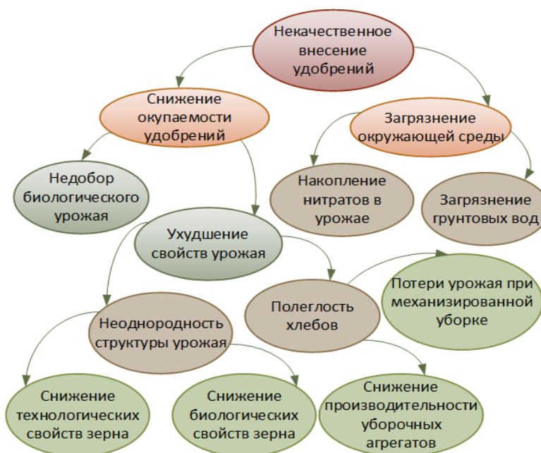
Рис. 2. Структура потерь удобрений при их некачественном внесении