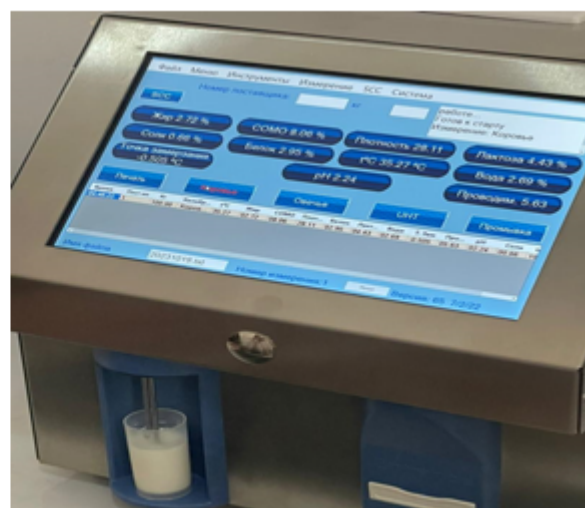
Рис.2. Дисплей анализатора