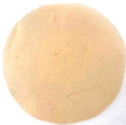
Рис. 3. Внешний вид пленочного материала

По органолептическим свойствам (внешний вид, цвет, запах, вкус) все пять экспериментальных образцов пленочного материала имеют близкие характеристики, их внешний вид на примере образца № 2 показан на рис. 3.