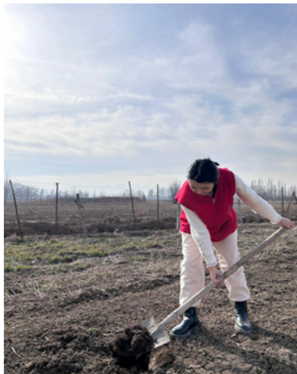
Сүрөт 1-2. Жапалак айыл башкармалыгында топурак үлгүлөрүн алуу