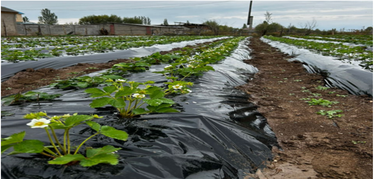
Сүрөт 6. Кулпунай талаасы (сорт Альбион)

агрономиялык жактан баалуу структурасы аз өлчөмдө болуп, сууга туруксуз фракциянын 44,9% ды түзгөнү аныкталды. Сууга туруктуу болгон майда бүртүкчөлүү фракциялардын 14,18 - 33,32% ды түзгөнү көрүнүп турат. Булар топурактын катуу фазасынын ажыраган агрегаттары. Алар морфологиялык жактан формасы, өлчөмү жана касиеттери боюнча айырмаланып, табигый «цементтерге» жабышкан кум, чаң жана ылай бөлүкчөлөрүнөн турат. Негизги табигый желимдер болуп гумус, ылайдын эң дисперстүү бөлүгү, темир жана алюминий гидроксиддери, кальций гидрокарбонаты саналат.