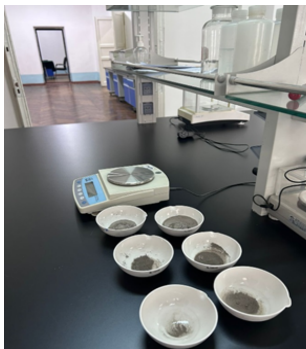
Сүрөт 4-5. Топурактын структуралык анализин аныктоо