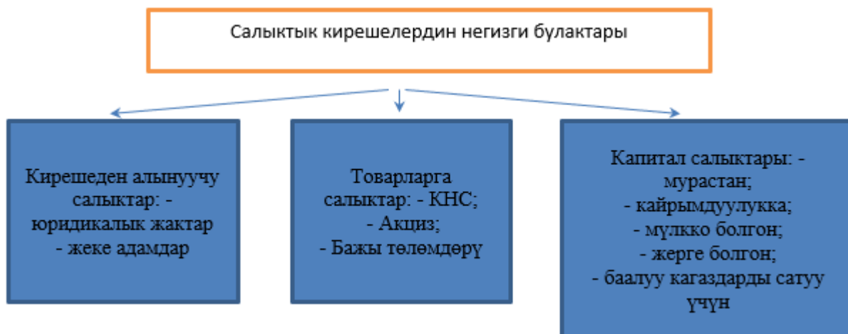
Схема 1. Салыктык кирешелердин негизги булактары

пропорционалдуу. Кыйыр салыктар - бул белгилүү бир товарларга жана кызмат көрсөтүүлөргө салыктар, алар баага кошумча акы алуу аркылуу алынат. Салык салуунун негизги булактары киреше, товарлар жана капитал болуп саналат.