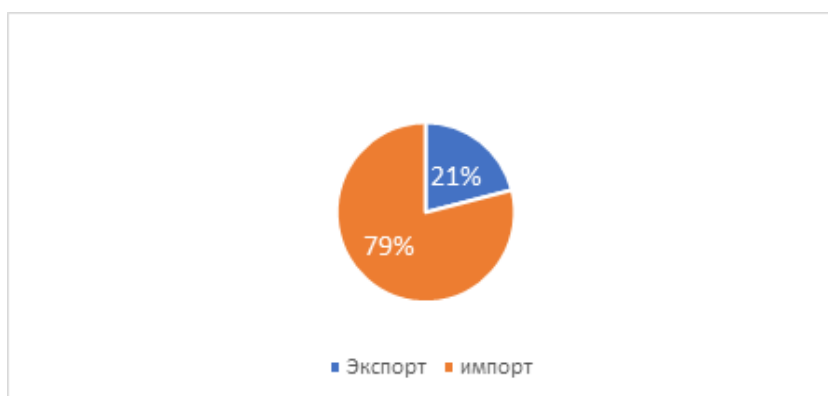
Диаграмма 1. Экспорт и импорт КР в 2023г.