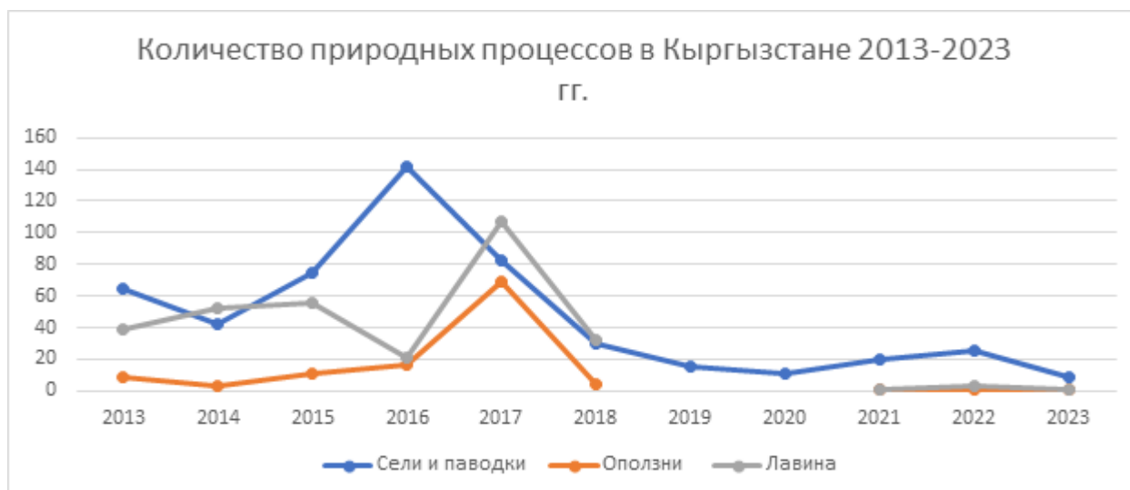
Диagr.1. Количество природных процессов в Кыргызстане 2013-2023 гг.