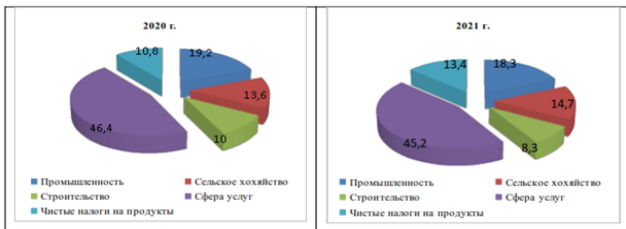
Диаграмма №1 Структура ВВП, %

на долю которого приходится 14,7% валового внутреннего продукта в 2021 году.