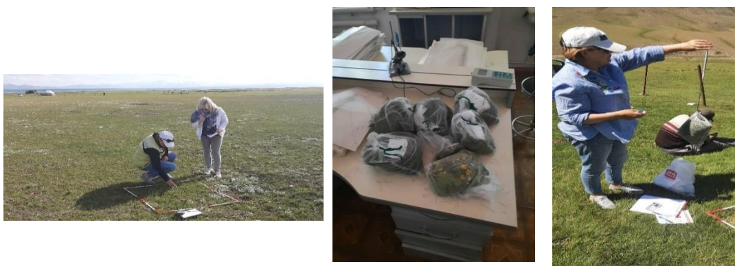
Рисунок 1. Отбор образцов растительности на анализы

Результаты исследований. Полевые исследования проведены согласно разработанного и утвержденного календарного плана работ, включая посещение пилотных участков на выбранных участках пастбищ. В ходе проведения полевых выездов проведена оценка текущего состояния пастбищ и растительного покрова, отобраны образцы для определения продуктивности пастбищ.